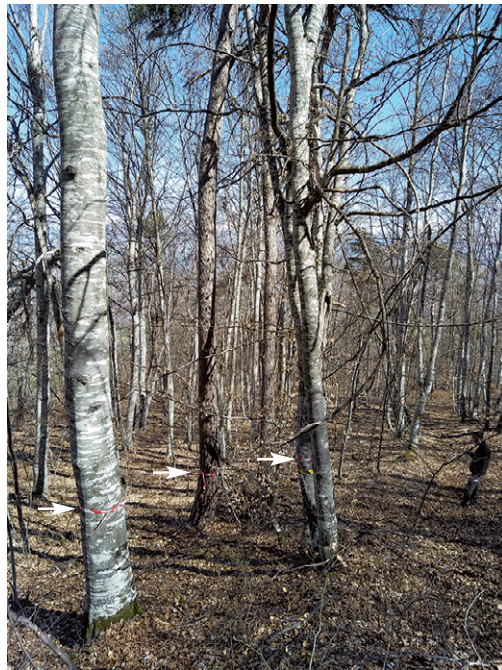
Photo 3 : Dans la hêtraie de Piégut, démonstration de désignation des tiges d'avenir.

La prise en compte des enjeux environnementaux dans la gestion forestière est clairement exprimée depuis une trentaine d'années. Elle passe par l'intégration des enjeux de biodiversité remarquable inscrits dans des périmètres de protection comme par des mesures généralistes de préservation de la biodiversité ordinaire (par exemple les instructions de conservation de 3 arbres morts, sénescents ou porteurs d'habitats / hectare, en forêt publique [ONF, 2018]). Le développement de l'Indice de biodiversité potentielle (LARRIEU, 2010) permet désormais d'identifier les paramètres sylvicoles permettant d'améliorer la biodiversité d'une forêt. Les outils de prise en compte des espèces liées à la forêt se sont multipliés ces dernières années (par exemple la Boîte à outil FSC [VALLAURI, 2021]) et permettent d'affiner la gestion au profit de certaines espèces.