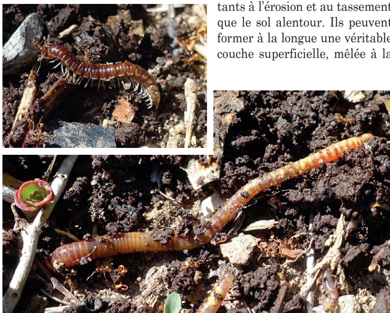
Photos 2 : Myriapode (mille-pattes) et ver de terre. Ces deux groupes d'espèces ont des tailles très variables : de 2 mm à 30 cm et plus. Le seul vrai « mille pattes » est australien, il possède 653 paires soit ...1306 pattes !

l'eau. On trouve généralement 10 à 100 vers/m 2 , qui peuvent entretenir sur cette surface jusqu'à 150 tubes de 900 m de longueur cumulée. En surface, les déjections de certains vers forment des édifices de plusieurs centimètres de haut (les turricules) à la sortie des galeries (Cf. photo 1). Ils sont composés de tortillons d'un diamètre proportionnel à la taille du vers et qui, avec le temps, en s'éboulant et en se cassant, donnent des agrégats de sol durcis. Les vers qui restent en profondeur les déposent dans leurs galeries, plutôt horizontales, sans cesse renouvelées. Dans un sol riche, ces déjections représentent 40 à 100 tonnes/ha. Concentrés en matière organique dont les vers consomment jusqu'à 6 tonnes par hectare et par an, et liés par du mucus produit par ces vers, ces agrégats sont beaucoup plus résistants à l'érosion et au tassement que le sol alentour. Ils peuvent former à la longue une véritable couche superficielle, mêlée à la