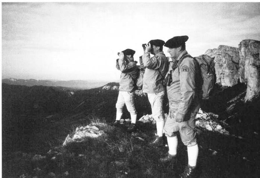
Photo 2 : Surveillance dans le Vercors S.D.G. Drôme

Le Code rural prévoit qu'un établissement public est chargé de coordonner l'activité des fédérations des chasseurs (art. L.221-1 et R.221-8 à R.221-23).